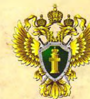
ПРОКУРАТУРА ГОРОДА САМАРЫ